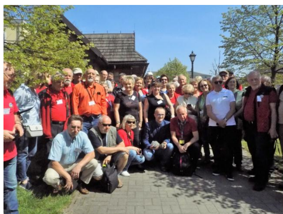
Spotkanie z Burmistrzem Sławkowa