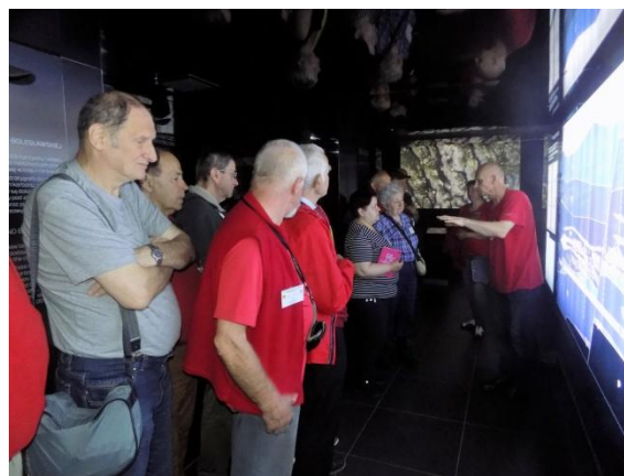
Kopalnia Wiedzy o Cynku