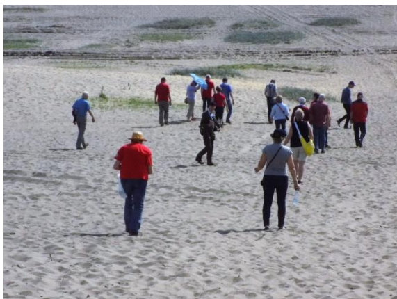
Spacer po Pustyni Błędowskiej i pamiątkowe zdjęcie