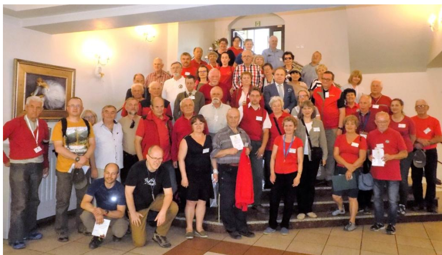
Ostatnie wspólne zdjęcie

Przewodnicy byli zadowoleni z warunków pobytu i smacznego wyżywienia, chwalili organizatorów za ciekawy program i sprawną realizację imprezy, podkreślali miłą atmosferę panującą przez wszystkie dni zlotu. Wszyscy docenili piękną pogodę.